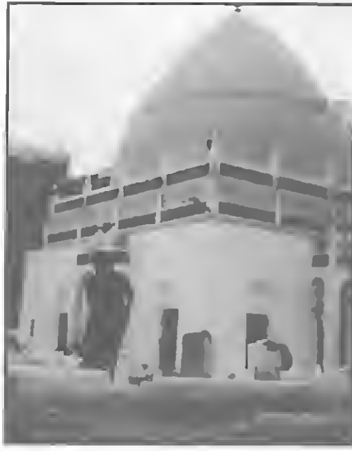
قبة الحبيب علي الحبشي بساحة الرياض بمدينة سيون